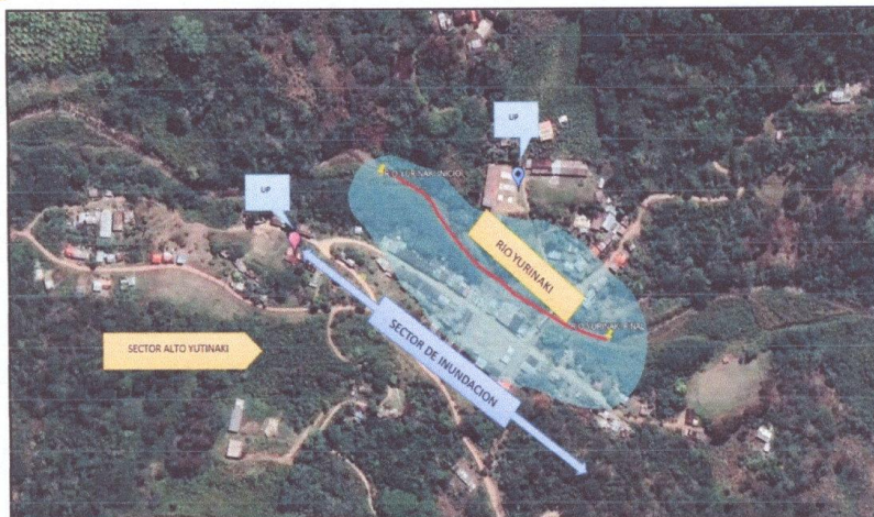
CROQUIS DEL TRAMO A INTERVENIR