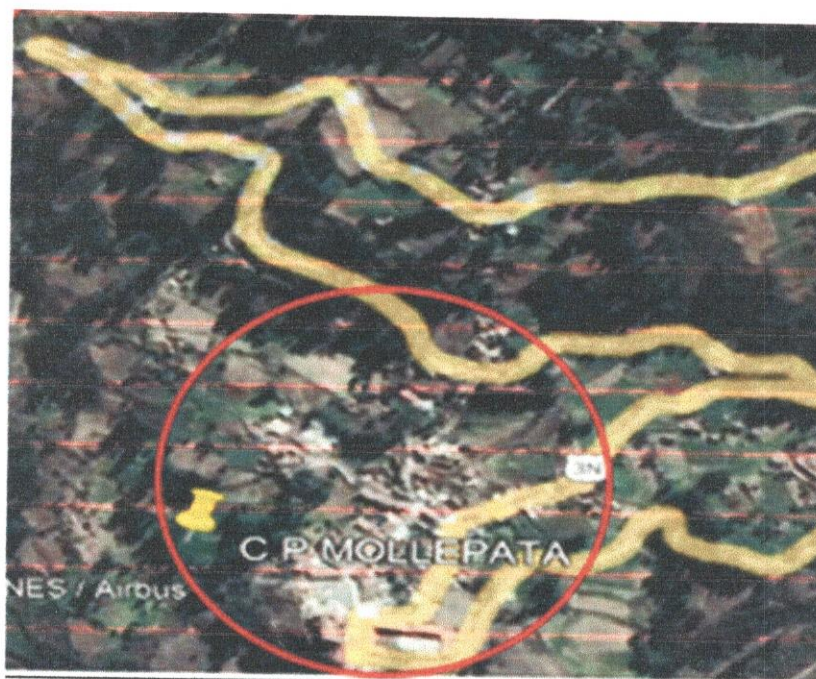
Figura 3. Ubicación del proyecto

“Año del Bicentenario, de la consolidación de nuestra Independencia, y de la conmemoración de las heroicas batallas de Junín y Ayacucho”