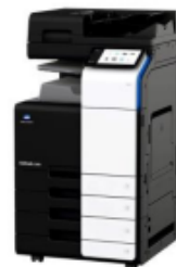
Imagen referencial de la impresora: