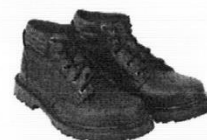
Zapatos de Seguridad con Puntera de Acero