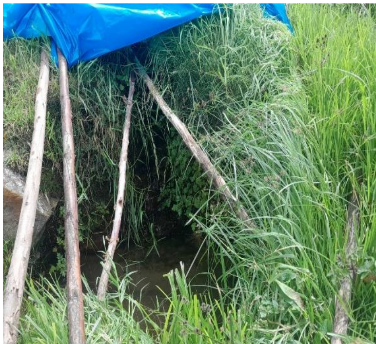
Gráfico 02: Manantial de tipo ladera en el sector Rayopampa.