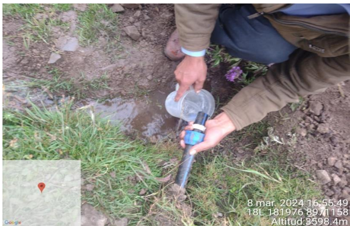
Gráfico 03: Manantial de tipo ladera en sector Escalón Puquio.