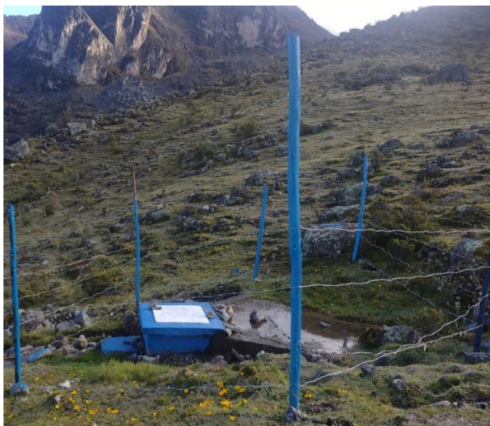
Gráfico 02: Manantial de tipo ladera en el sector Cachi.