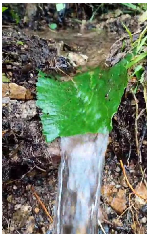
Gráfico 02: Manantial de tipo ladera en Bellavista Baja.