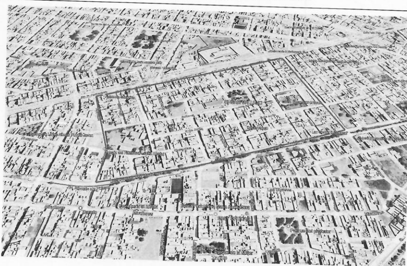
LAMINA N° 02 - UBICACIÓN DEL PROYECTO