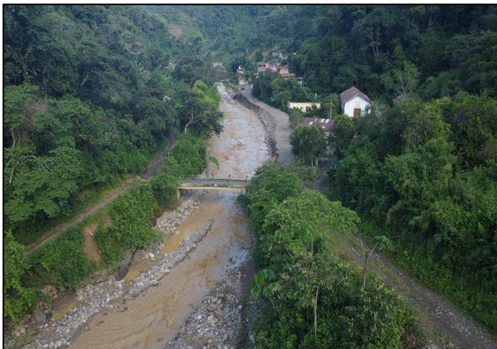
Vista del puente vehicular challuma