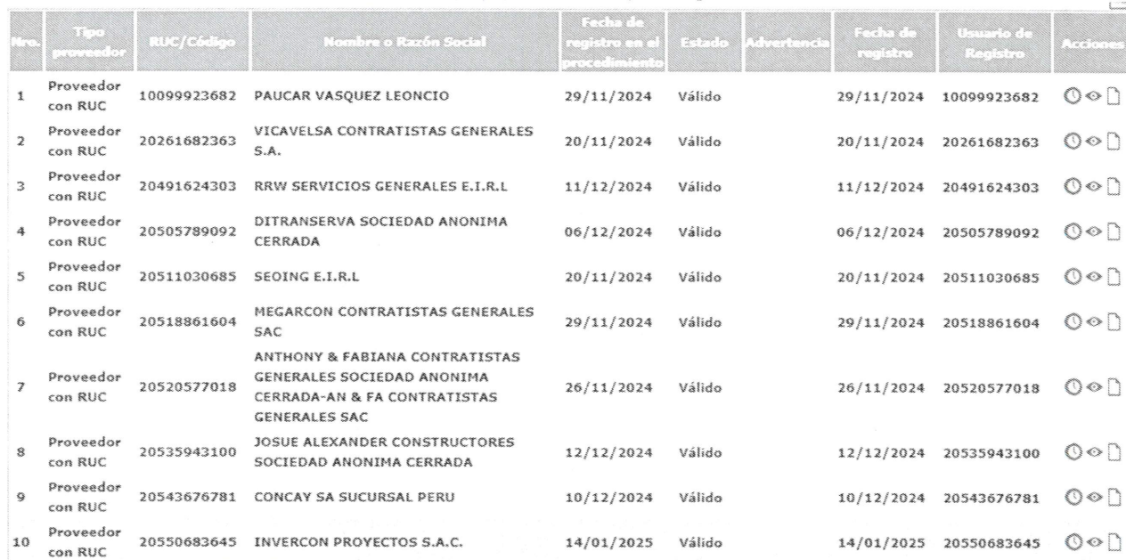
Cuadro N° 01 Detalle de los participantes validos que se registraron

25 registros encontrados, mostrando 10 registro(s), de 1 a 10. Página 1 / 3.