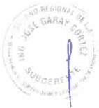
FORMATO 03: VALORIZACIÓN DE OBRA (PRINCIPAL / ADICIONAL) N° CORRESPONDIENTE AL PERIODO DEL.... AL .... DE ..... DE.....