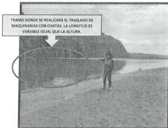
FIGURA N°04: Vista donde se ejecutará el traslado de maquinaria con chatas.