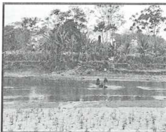
FIGURA N°03: Tramo del acceso donde se hará el mejoramiento de vía para el ingreso de las maquinarias hacia el lugar de ejecución de la actividad.