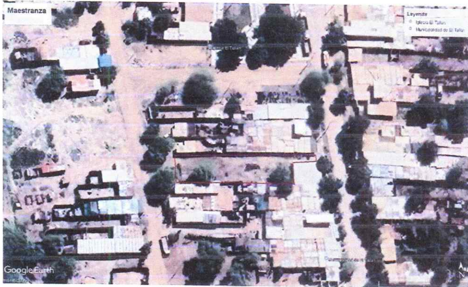
Perimetro de maestranza