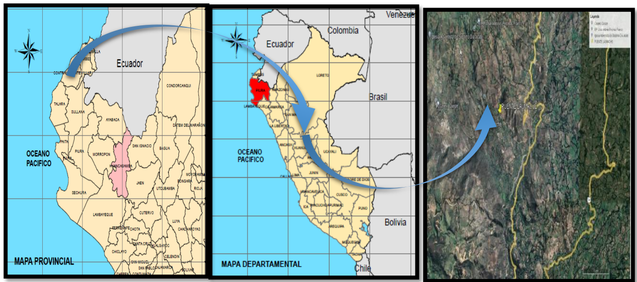
Figura N°01. Ubicación del proyecto a nivel departamental, provincial y Local