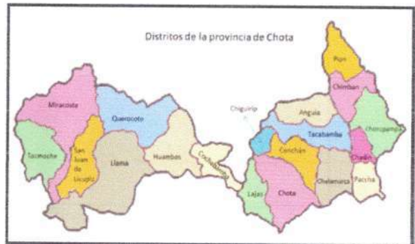
Ubicación del departamento de Cajamarca