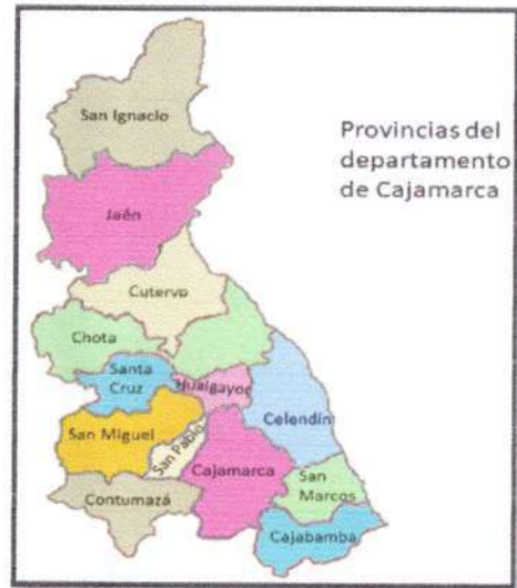
Ubicación de la provincia de Chota