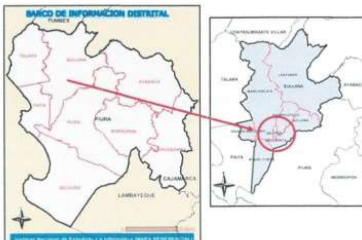
Figura 1. Ubicación geográfica y política