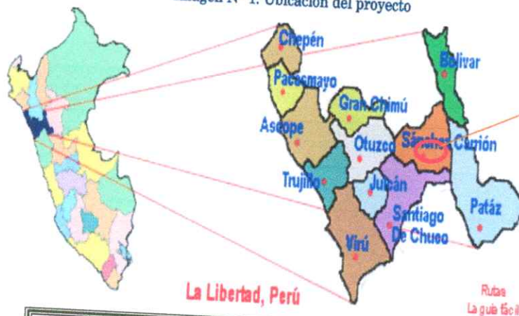
Imagen N° 1. Ubicación del proyecto