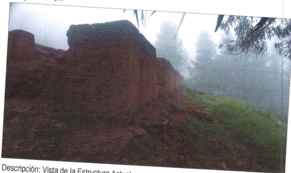
Descripción: Vista de la Estructura Actual