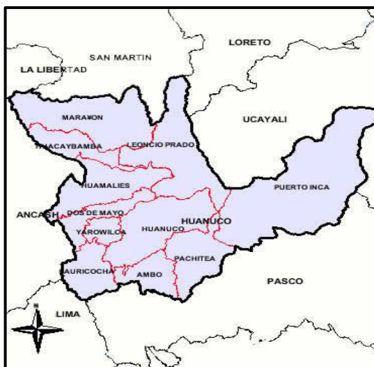
UBICACIÓN EN EL MAPA REGIONAL