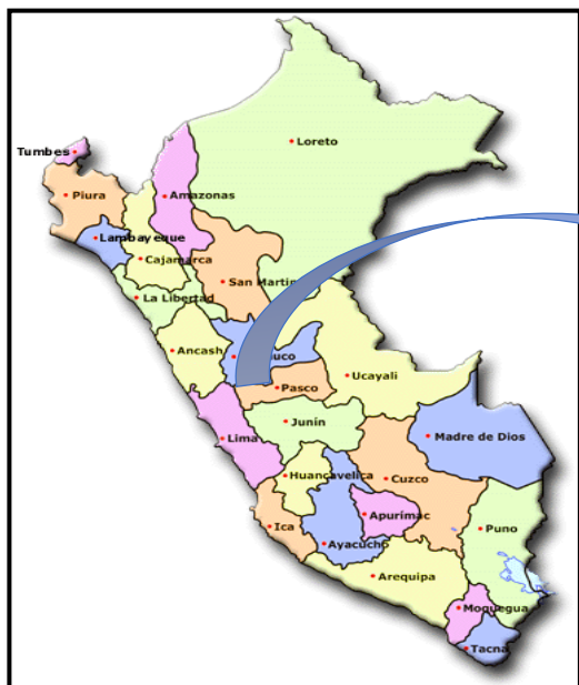
UBICACIÓN EN EL MAPA NACIONAL