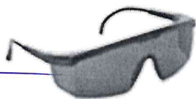
LENTES DE SEGURIDAD