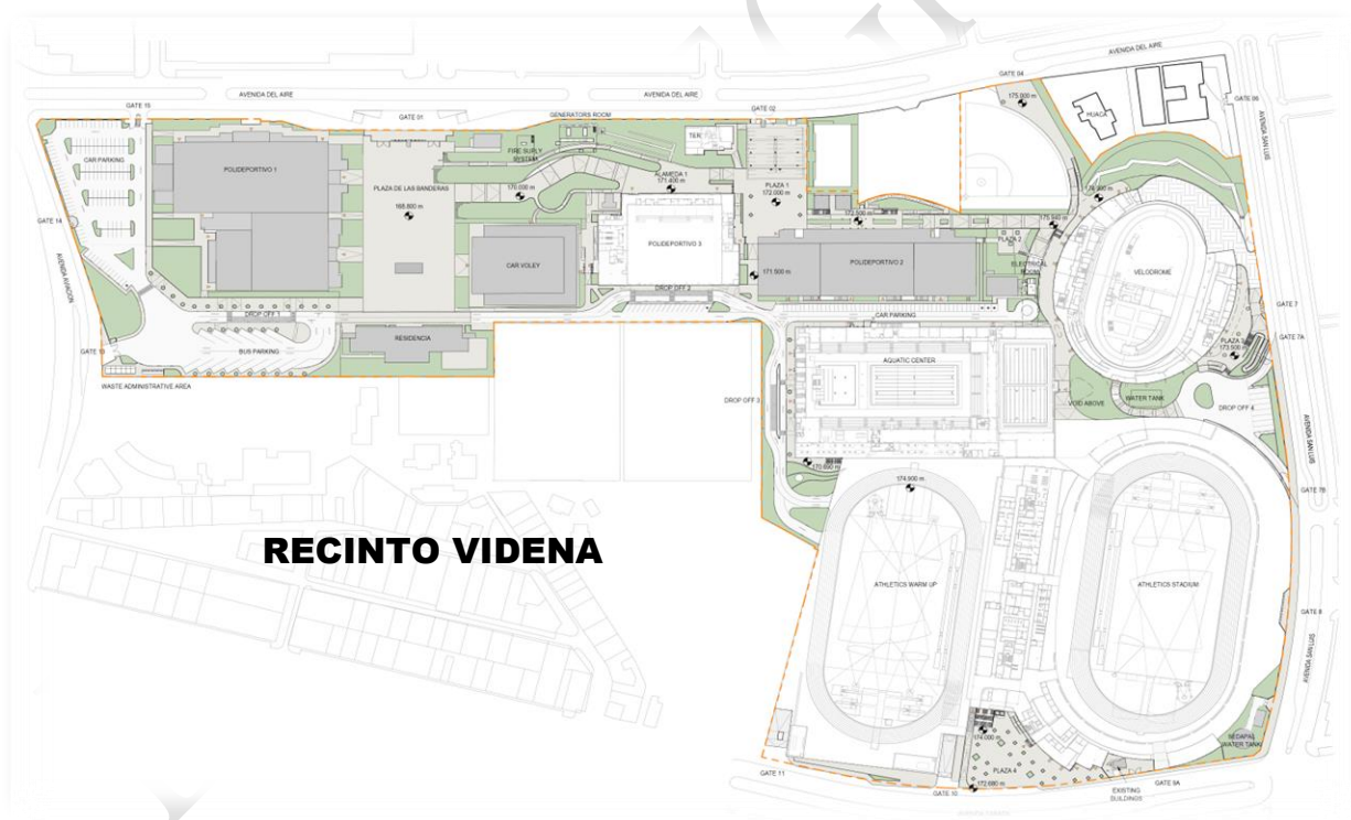
Imagen N°1: Ubicación del Proyecto de Inversión VIDENA

Aprobado mediante : Resolución Directoral N°0001-2023-MTC/34.10 Fecha de Aprobación : 12.07.2023 Actualización de Valor Referencial : Resolución Directoral N° 002-2024-PEL-PEL.04 Fecha de Aprobación : 11 de enero de 2024