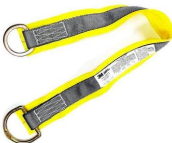
imagen referencial del adaptador de anclaje portátil en reata