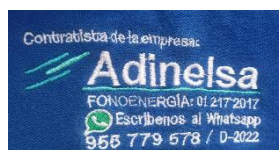
IMAGEN REFERENCIAL DEL BORDADO