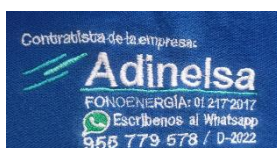
IMAGEN REFERENCIAL DEL BORDADO