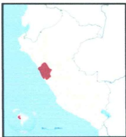
MAPA DE ANCASH Y PROVINCIAS