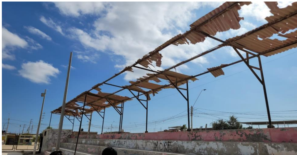
Imagen N°02: Cerco perimétrico oxidado.

Imagen N°01: Calaminon imparcialmente incompleto