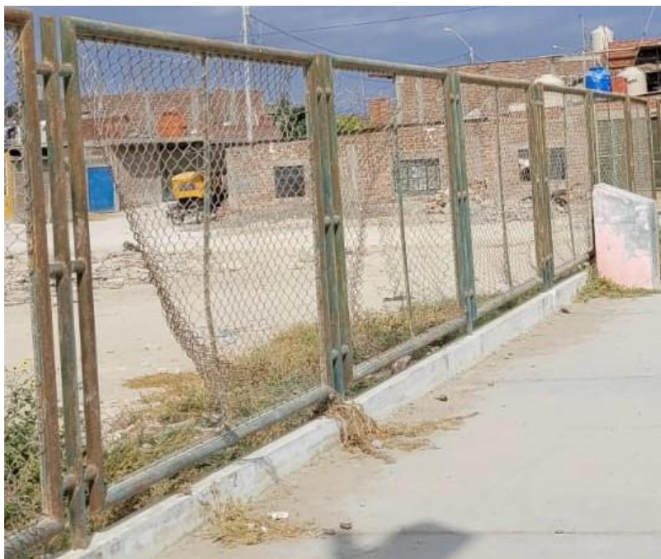
Imagen N°03: Malla de Arco deteriorada.