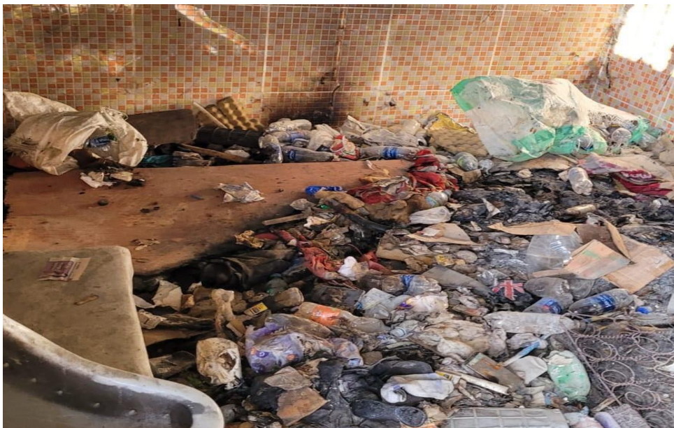
Imagen N°05: CISTERNA SIN TAPA Y CON EXCESO DE RESIDUOS.