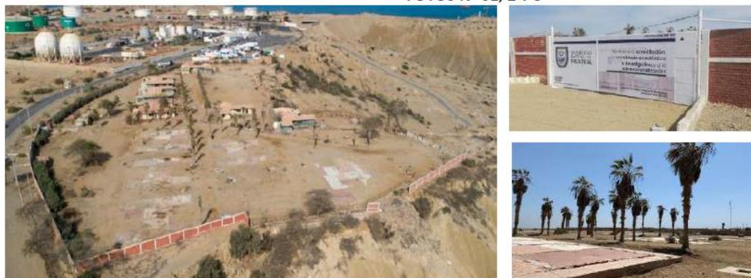
Vistas del terreno ubicado en el distrito de Pariñas