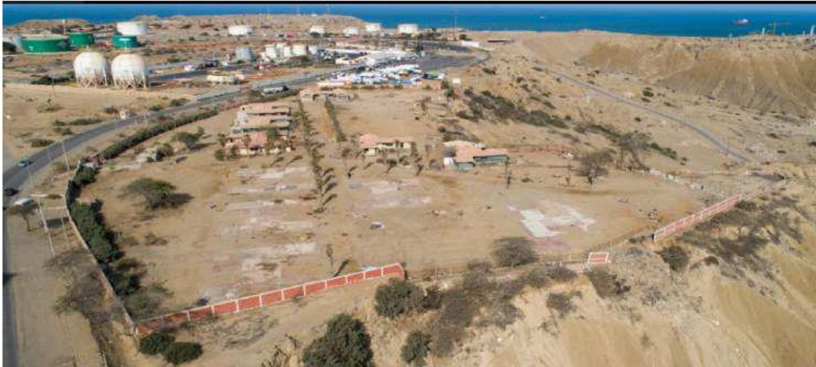
Imágenes del Google Earth.