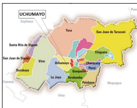
Figura N°3: Ubicación de la zona del proyecto y áreas de influencia en el Distrito de Uchumayo