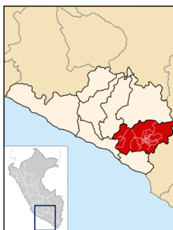
Figura N°2: Ubicación del Distrito de Uchumayo en la Provincia de Arequipa