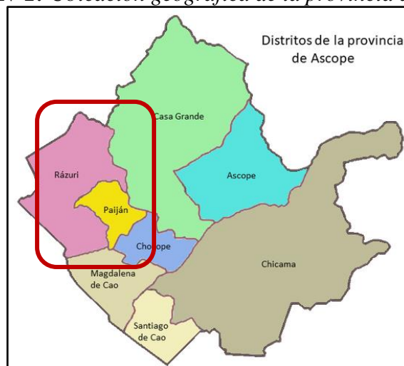
Figura N°3: Ubicación geográfica del distrito de Ráuri.