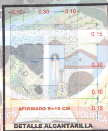
Ilustración N° 02: Detalle de desarenador