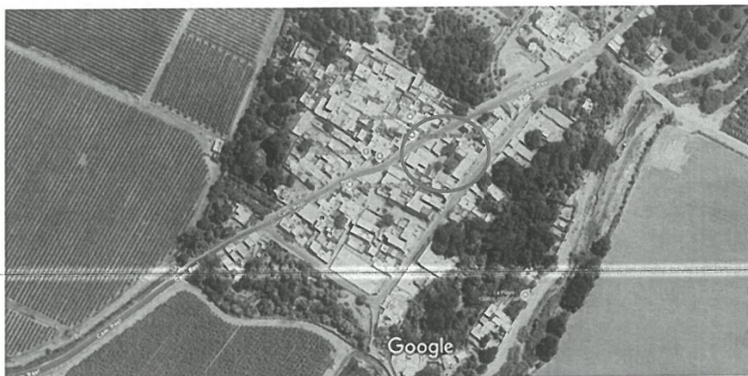
Ubicación: "I.E. SANTA BARBARA N° 22364"