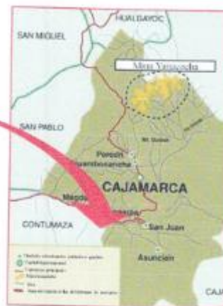
Imagen 01: Mapa de Ubicación del Proyecto