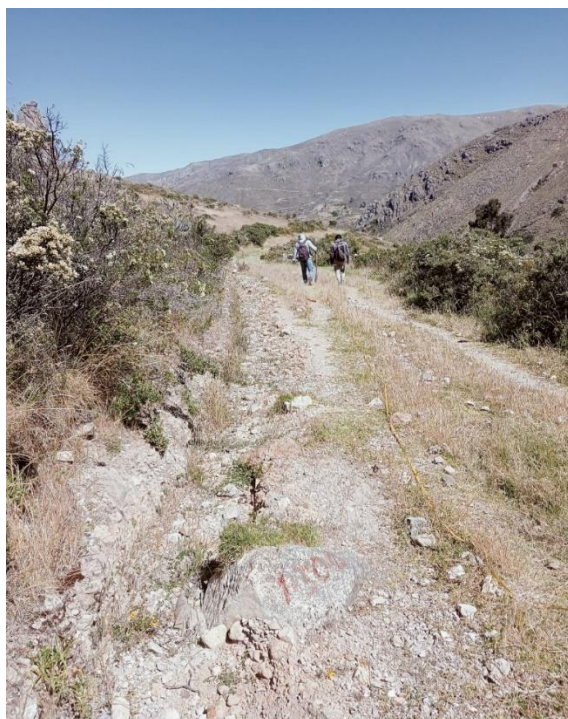
Foto N°04.- Vista de los caminos de herradura que dificulta el transporte de los productos que enlazan a los pueblos de San Francisco de Sangayaico y Santiago de Chocorvos

Por esto muchas veces los agricultores de esta zona de influencia cultivan sus productos solo para autoconsumo y el excedente mínimo que se tiene lo comercializan a través del trueque entre ellos mismos, es decir intercambian sus productos pese a que no pueden sacar sus productos a comercializar con otros