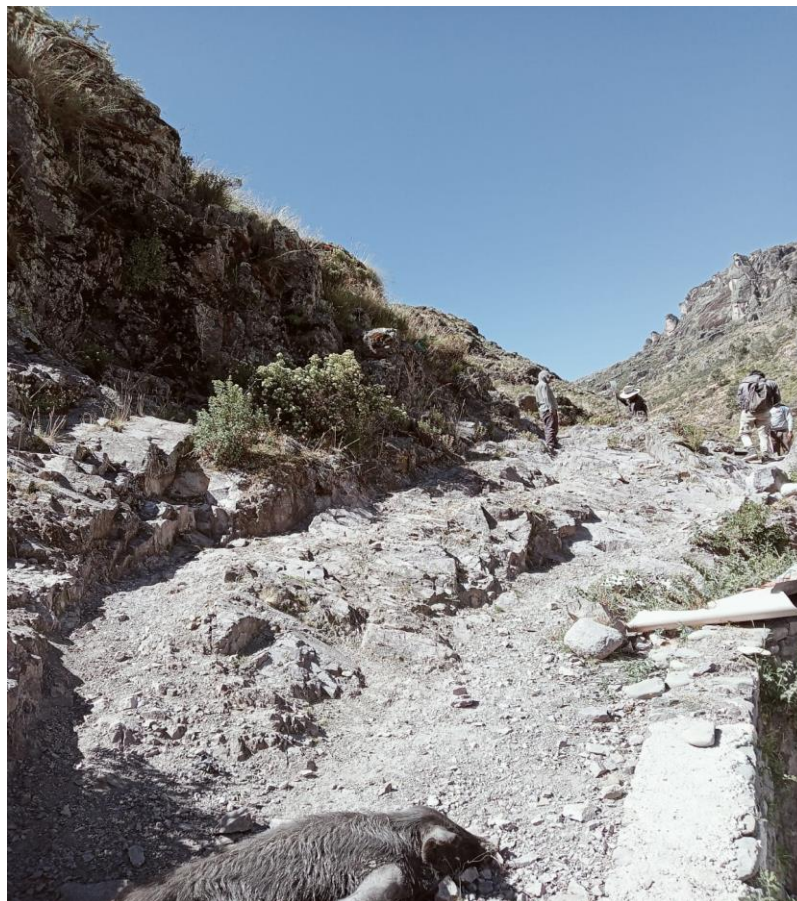
Foto N 06.- Vista del camino vecinal deteriorado que dificulta el transporte de carga y pasajeros, resulta intransitable.

La educación impartida en los distritos de San Francisco de Sangayaico y Santiago de Chocorvos es de bajo rendimiento, se tiene nivel primario en casi todas las comunidades del distrito, pero los centros educativos de nivel secundario solamente se ubican en algunas comunidades, los docentes vienen de la ciudad de Huaytará, Huancavelica y otras localidades cercanas a dictar clases. los profesores y alumnos son afectados con la inaccesibilidad de las trochas carrozables donde se puedan movilizar en vehículos, por contrario, realizan grandes caminatas por herraduras a sus respectivas Instituciones Educativas, los alumnos no pueden asimilar sus clases con normalidad ya que muchas veces llegan retrasándose en el horario y muy cansados pese a que tienen que levantarse muy temprano y emprender largas caminatas para ganarle al tiempo, desmotivando su desenvolvimiento con los docentes, estas inadecuadas condiciones de transitabilidad genera pérdida de tiempo en los estudiantes, reduciendo las posibilidades de estudiar, hacer tareas y complementar lo aprendido en clase. Por estas dificultades muchos alumnos optan por dejar de estudiar y ponerse a trabajar ayudando a sus padres en la agricultura u otras actividades perjudicando su nivel de aprendizaje, dándole cabida aún más al analfabetismo.