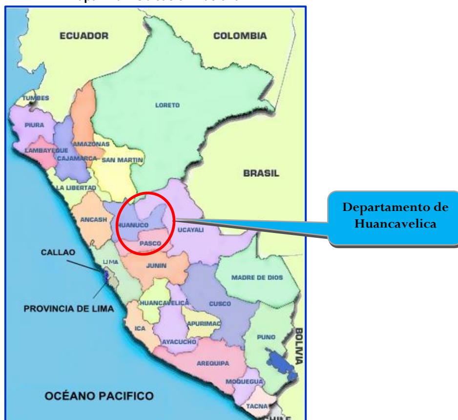
Mapa N°01: Ubicación Nacional