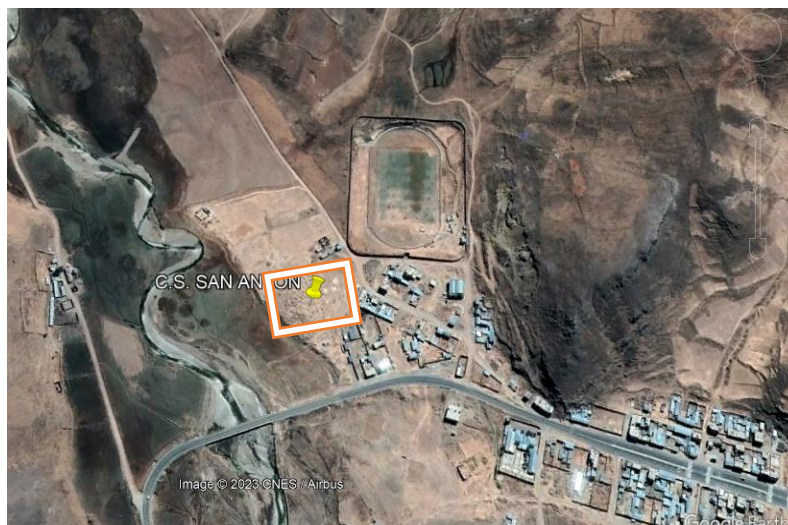
FIGURA N° 2: TERRENO SIN CONSTRUCCION

Además el establecimiento cuenta con un terreno sin construcciones el cual se encuentra en las coordenadas 356964.89m E y 8387824.32m S. El consultor en coordinación con la Dirección Regional de Salud Puno, deberá evaluar la ubicación mas adecuada para el funcionamiento del establecimiento de Salud.