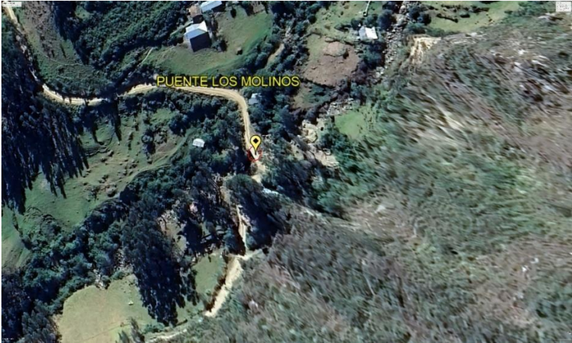
Imagen N° 3: Vista satelital del puente Los Molinos.

A continuación, se muestra la accesibilidad a la zona desde la ciudad de Trujillo.