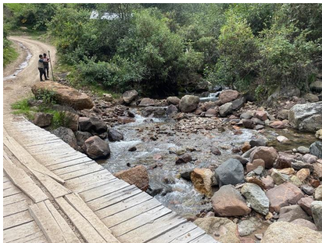
Imagen N° 5: Vista del puente existente y el río Sumanga aguas abajo.