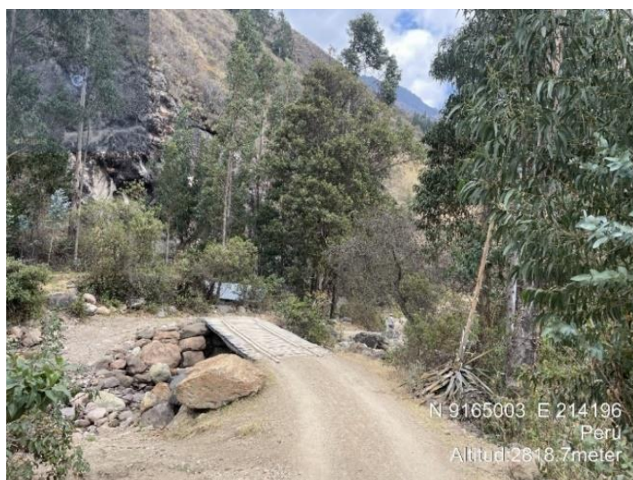
Imagen N° 4: Vista del puente y ancho de vía existente.

La situación actual del puente los Molinos es de precaria condición, cuenta con elementos de soporte troncos de madera utilizados como vigas y tabloncillos por encima del mismo utilizado como plataforma de tránsito; así como la presencia de rocas arrastradas por el cauce y socavación en ciertas áreas.