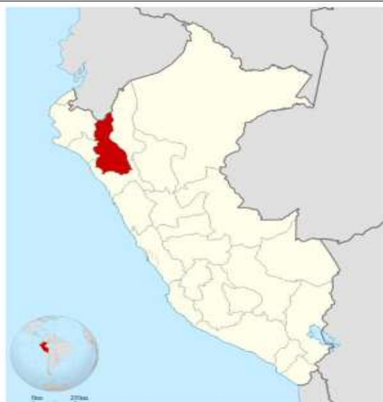
Ilustración 1: Mapa macro de la localización del Perú