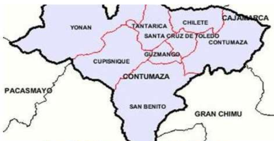
Ilustración 3: Mapa de la provincia de Contumaza