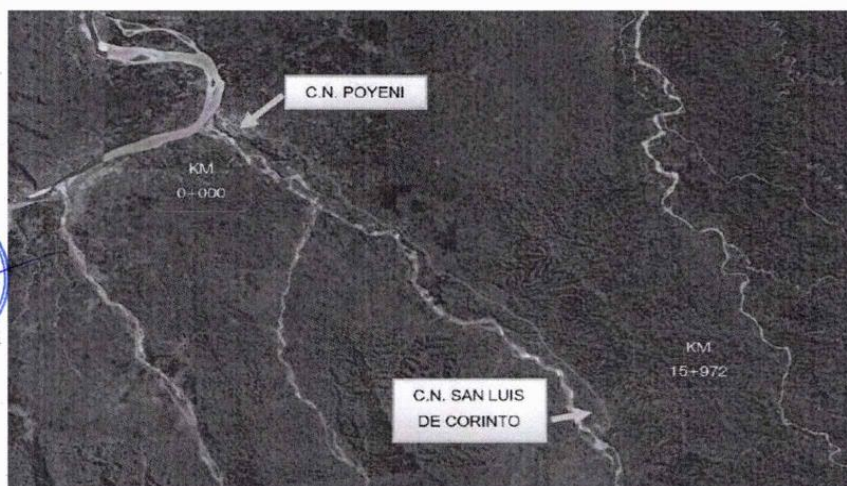
Ubicación dentro del Valle de la cuenca del tambo -Distrito de Rio Tambo-Provincia de Satipo-Región Junín