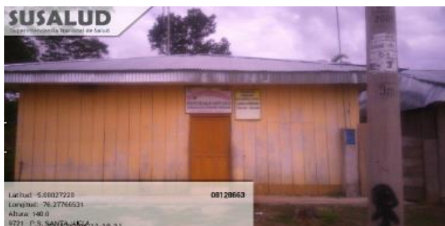
Imagen 1: Vista Frontal del Puesto de Salud Santa Lucia

MEJORAMIENTO DE LOS SERVICIOS DE SALUD DE LOS PUESTO DE SALUD I-1 SANTA LUCIA Y ACHUAL LIMON DEL DISTRITO DE YURIMAGUAS – PROVINCIA DE ALTO AMAZONAS – DEPARTAMENTO DE LORETO - CUI 2459370