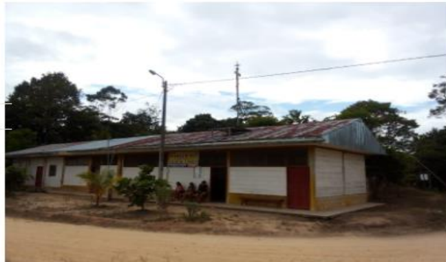
Imagen 2: Vista Frontal del Puesto de Salud Achual Limon