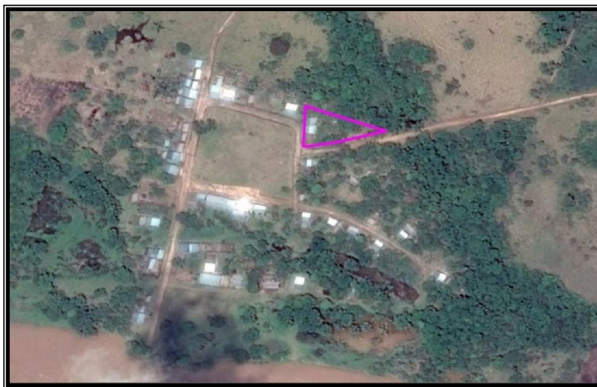
Localidad de Achual Limón

Ante ello se planteó el PMF siguiente; el que responde a un análisis de demanda de cada una de las Unidades Prestadoras de servicios de salud (UPSS), relacionadas con el valor referencial del volumen de producción optimizada de los ambientes y su grado de utilización.