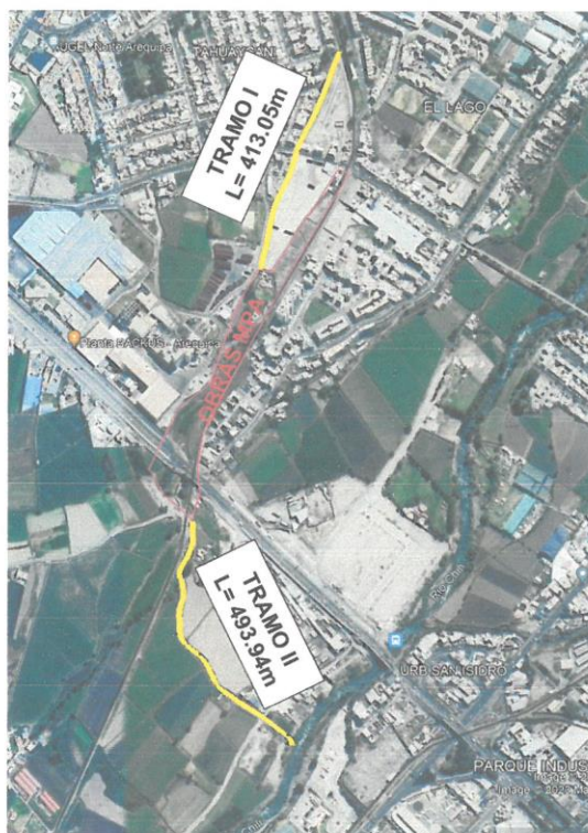
TORRENTERA CHULLO: TRAMO I y TRAMO II (DESDE AV. METROPOLITANA HASTA RIO CHILI)