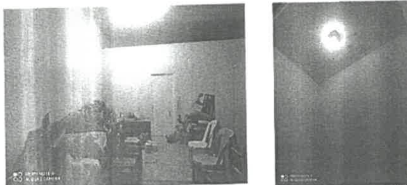
Figura 3. Espacios mal utilizados y mal funcionamiento eléctrico