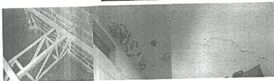
Figura 1. Deterioro estructural del centro cultural