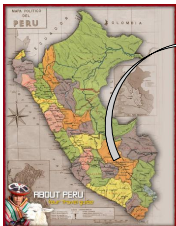
MAPA POLITICO DEL PERU