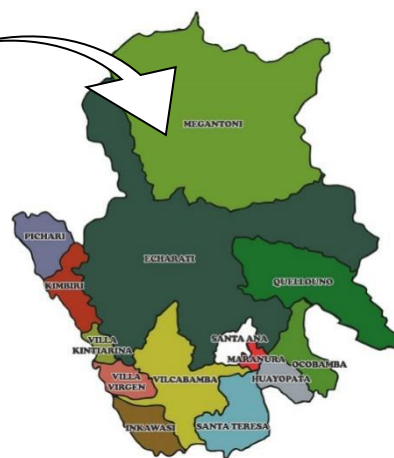
PROVINCIA DE LA CONVENCION