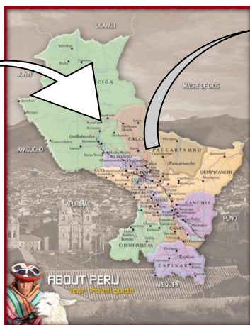
DEPARTAMENTO DEL CUSCO