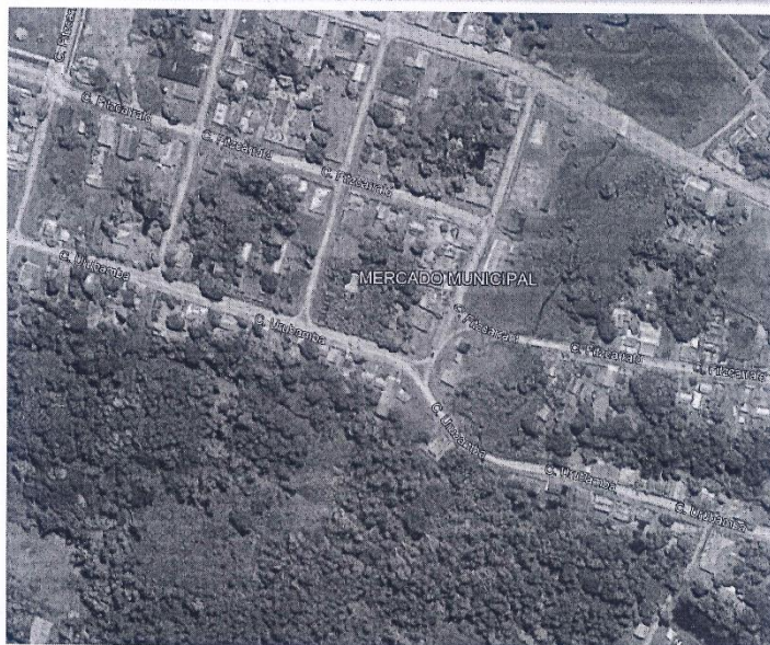
MERCADO MUNICIPAL DEL CENTRO POBLADO SEPAHUA

El clima predominante es característico del bosque húmedo tropical, existe muy poca variación de temperatura y humedad entre el día y la noche, las lluvias son abundantes (varían desde 1,900 a 2,200 mm anual); la precipitación promedio anual es de 1952.23 mm. En Atalaya se distingue dos periodos muy marcados, el periodo lluvioso comprende 8 meses de año, empieza en setiembre y perdura hasta abril, luego se presenta el periodo menos húmedo que abarca 4 meses (de mayo a agosto). El valor promedio mensual de la temperatura es de 27.5°C y oscila entre 18.3°C (agosto) a 37.4°C (noviembre).