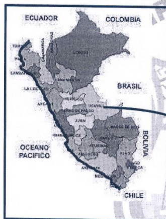
MAPA DEL PERU

Inicio : 713396.94 m E 8767690.49m N Altitud : 282.00msnm