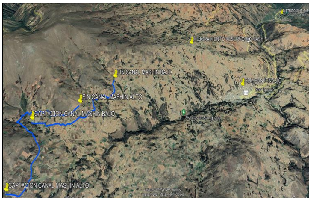
IMAGEN N°01: Ubicación del proyecto