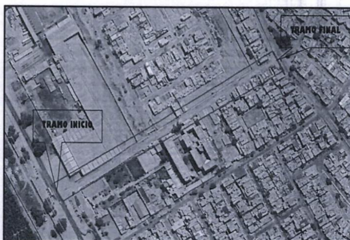
Imagen 01; En la imagen se muestra la ubicación satelital del proyecto.

COORDENADAS UTM - DATUM WGS 84 - ZONA 17L