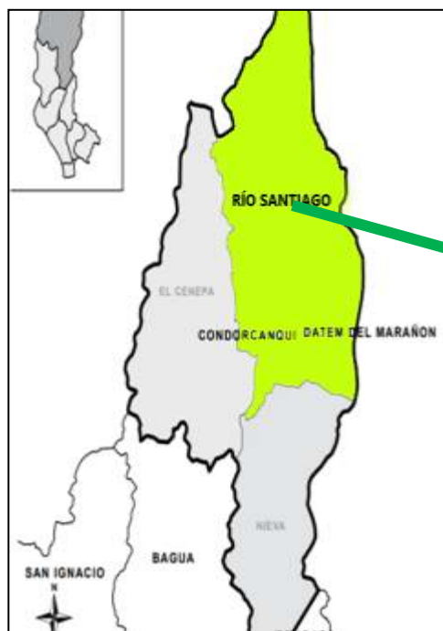
DISTRITO DE RIO SANTIAGO