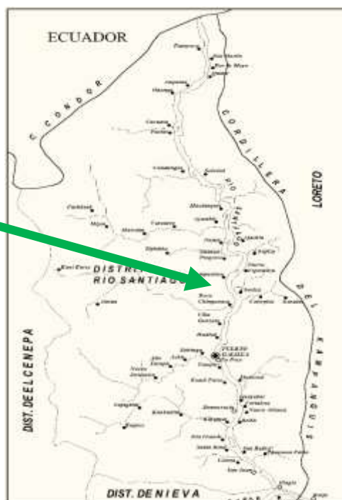
CC. NN TIERRA ROJA