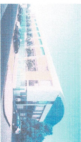
Vista de la remodelación de la fachada lateral y posterior