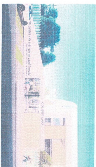
Vista de portico de ingreso