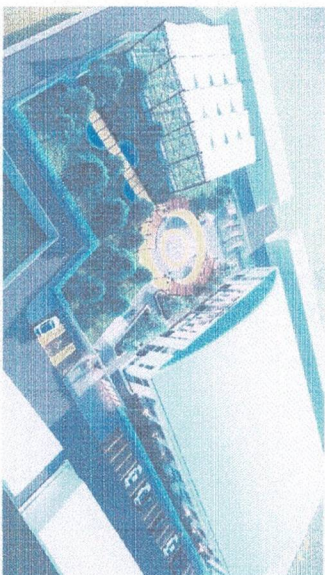
Vista aérea de los espacios abiertos