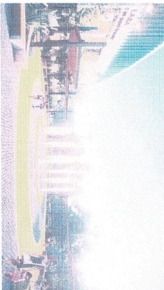
Vista de la plaza principal

De igual modo, se ha considerado el diseño de los porticos de ingreso y del cerco perimetrico de carpintería de acero.