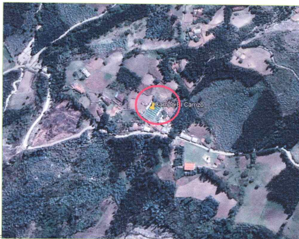
Caserío El Carrizo, Distrito de Chugay