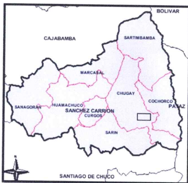
Distrito de Chugay en la provincia de Sánchez Carrión