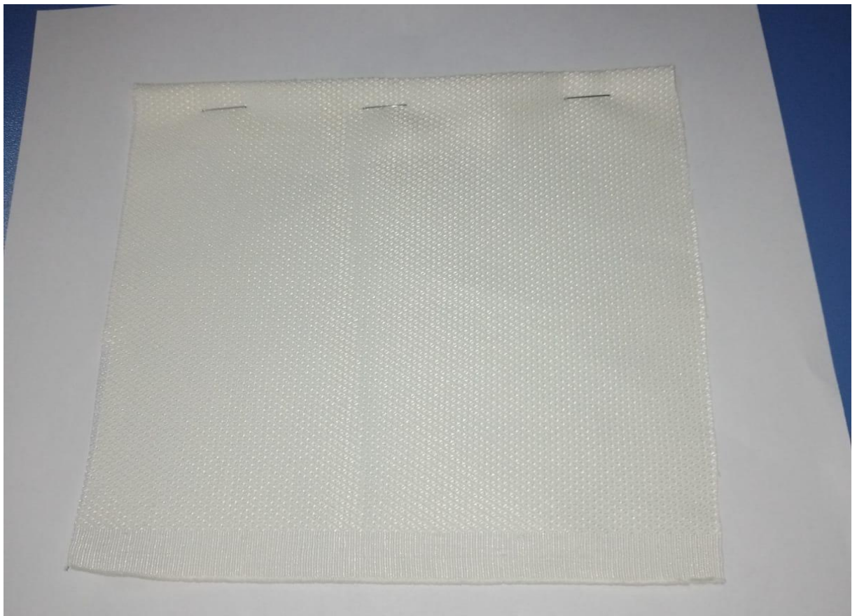
COLOR CELESTE BEBE