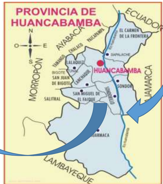
FIGURA N° 2: PROVINCIA DE