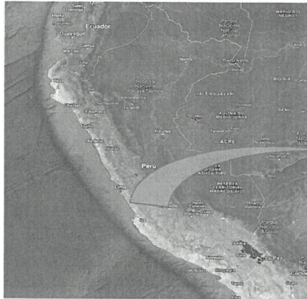
Imagen N° 01: Mapa del Perú