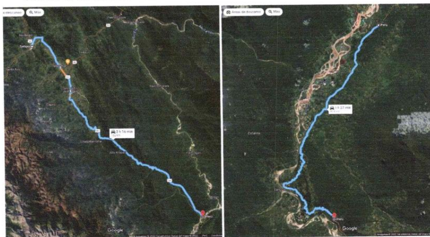
IMAGEN N°03: RUTA DE ACCESO/FUENTE: EQUIPO TÉCNICO 2023

El financiamiento proviene del Sector Público, POR 07: FONDO DE COMPENSACION MUNICIPAL, garantizando la entidad de acuerdo con las bases, las condiciones de financiamiento, la misma que debe ser certificada por el área de presupuesto.