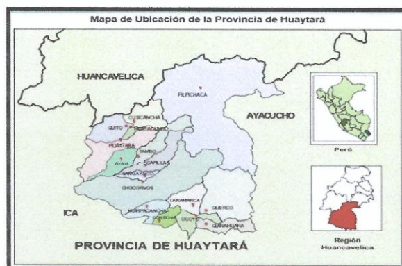
Figura N° 01: Localización De La Zona De Estudio Dentro De La Región Huancavelica