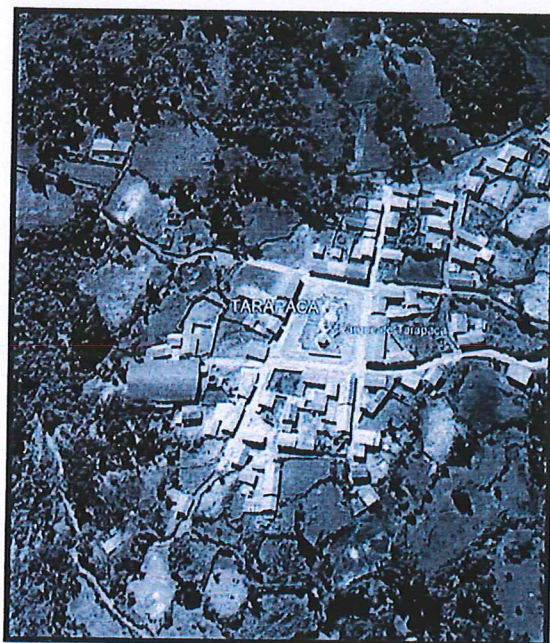
Lugar del proyecto.

El acceso a la localidad de Tarapaca desde la ciudad de Huaraz, se encuentra descrita según el cuadro que a continuación de detalla: