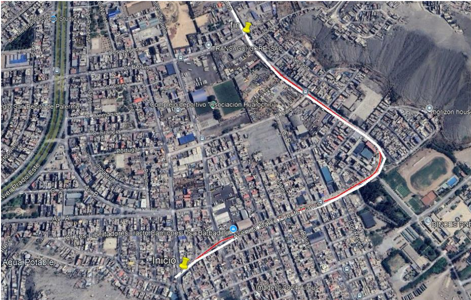
Imagen N.º 01: Delimitación de la zona de intervención

El proyecto consiste en la construcción de pistas y veredas con un pavimento rígido, en toda la zona de intervención.