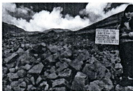
Imagen N° 38: Vista panorámica de la Cantera de enrocado "Jatuncacca"